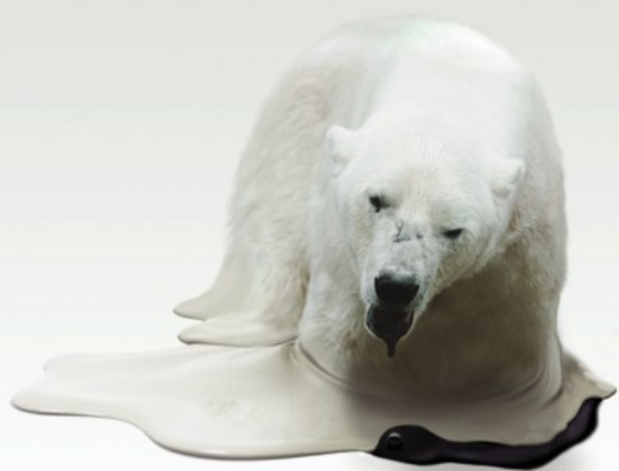
Kawano Takeshi. 2011